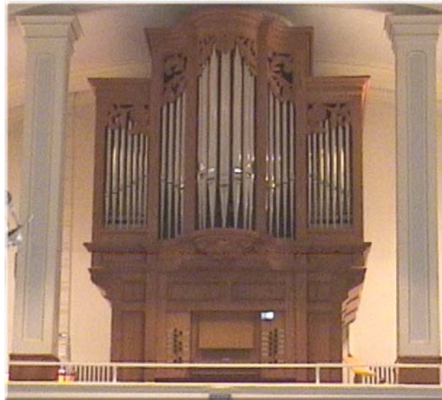
Guilbault-Thérien, Opus 48, 2001

2 claviers manuels et pédalier 18 jeux / 22 rangs / 1 063 tuyaux Traction mécanique des claviers et des jeux